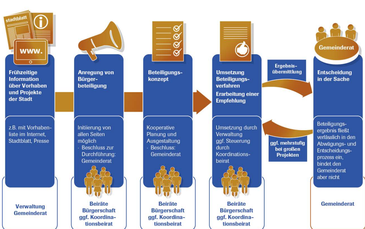
Abbildung 1: Standardisierter Ablauf mitgestaltender Bürgerbeteiligung in Heidelberg

Um die Umsetzung dieser Merkmale zu unterstützen, richtet der Oberbürgermeister eine Koordinierungsstelle für Bürgerbeteiligung ein (vgl. Kap. 10). Sie berät die Einwohnerinnen und Einwohner ebenso wie die Fachämter, steht ihnen mit Expertise und Information zur Seite, hilft bei der Entwicklung der Beteiligungskonzepte mit und unterstützt den gegenseitigen Informationsaustausch. Die Stelle wird hierfür mit einem entsprechenden Budget ausgestattet.