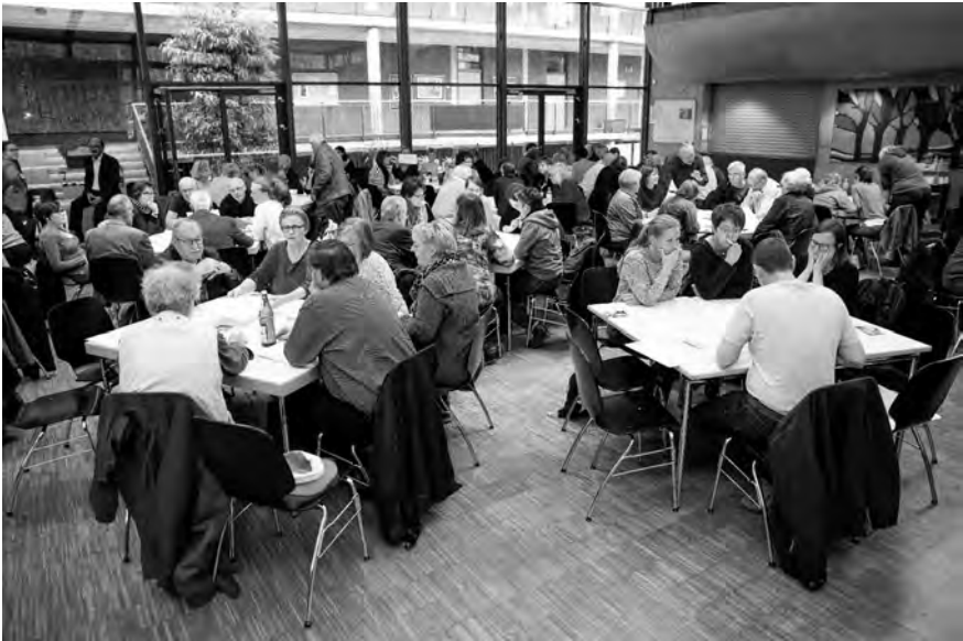
Abb. 2: Gemeinwohlcheck 2019