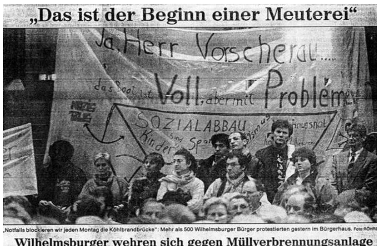
Abbildung 5: »Meuterei« - Veranstaltung am 16. Februar 1994 mit Umweltsenator Fritz Vahrenholt. Das Transparent mit dem Text: »Herr Voscherau, das Boot ist voll, aber mit Problemen« nahm Bezug auf die Aussage von Bürgermeister Voscherau 1993, in Wilhelmsburg sei das Boot voll – gemeint waren »zu viele Ausländer«. Der Wilhelmsburger Protest dagegen organisierte sich ganz bewusst international: Alle Bevölkerungsgruppen gingen gemeinsam und solidarisch auf die Straße.

Dass nach dieser Vorgeschichte ausgerechnet Wilhelmsburg im Jahre 1993 Standort einer Müllverbrennungsanlage (MVA) werden sollte, konnte auch der damalige Umweltsenator (4) den empörten Wilhelmsburgern nicht vermitteln. Sie überreichten ihm auf einer Großveranstaltung im Bürgerhaus einen Katalog mit den zwölf dringendsten Forderungen für eine positive Stadtteilentwicklung und beschlossen Aktionen.