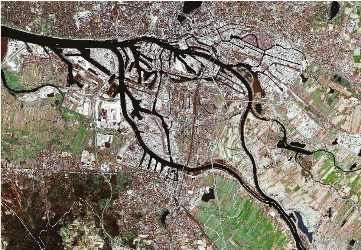
Abbildung 3: Satellitenbild: Wilhelmsburg als Flussinsel zwischen Norder- und Süderelbe im Zentrum Hamburgs

Die Stadtteile haben keine von ihren Bewohner/innen gewählte Vertretungen und seit 2007 auch keine eigenen Ortsämter mehr. Es gibt lediglich Regionalausschüsse als Ausschüsse der Bezirksversammlung und eine/n Regionalbeauftragte/n. Diese/r hat die Aufgabe als Regionalbeauftragte/r mittlerweile nur noch als Ergänzung zu seiner eigentlichen Funktion und besitzt kein Büro mehr vor Ort.