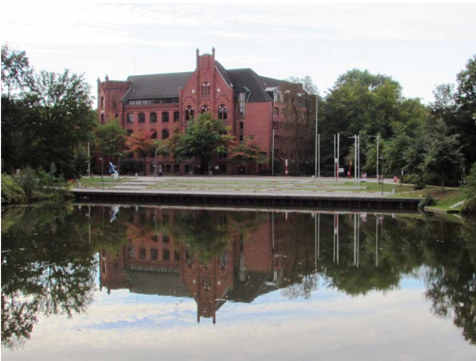
Abbildung 1: Wilhelmsburger Rathaus

Viel hatte nicht gefehlt, dass vor 50 Jahren der gesamte Wilhelmsburger Westen – und damit die Hälfte des Siedlungsgebietes – der Hafenerweiterung zum Opfer gefallen wäre: Sollte das alte Rathaus der zeitweise unabhängigen Stadt und ehemaligen preußischen Landgemeinde dann vielleicht als Mahnmal inmitten von Lagerhallen und Containern stehen?