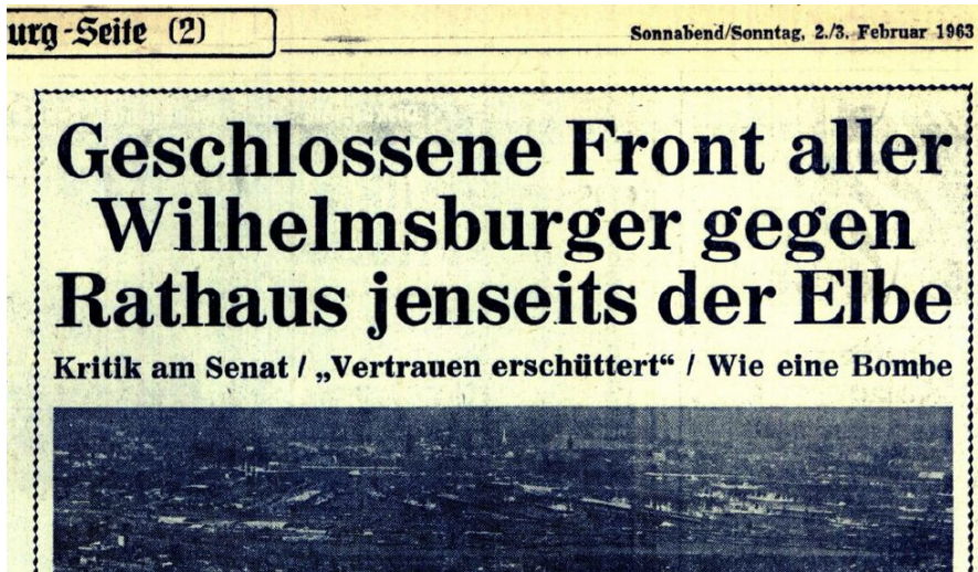
Abbildung 4: »Geschlossene Front aller Wilhelmsburger« gegen Pläne zur Hafenerweiterung – Hamburger Abendblatt 1963, © Ausschnitt Hamburger Abendblatt

bis 1977 amtierende Ortsamtsleiter Hermann Westphal agierte mehr wie ein Ortsbürgermeister und verteidigte nach der verheerenden Flut 1962 Wilhelmsburg als Wohnort gegen die geplante Hafenerweiterung.