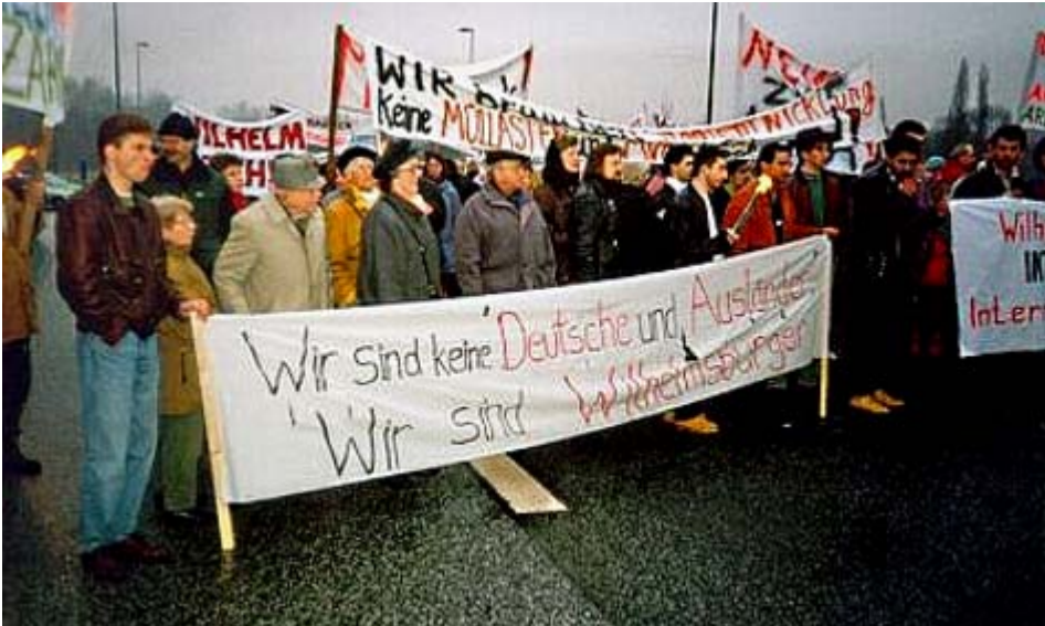
Abbildung 2: »Wir sind keine Deutsche und Ausländer - Wir sind Wilhelmsburger« – Demo 1994

und Ausländer – wir sind Wilhelmsburger« wurde zu einem bekannten Slogan bei den monatelangen Aktionen gegen eine geplante Müllverbrennungsanlage.