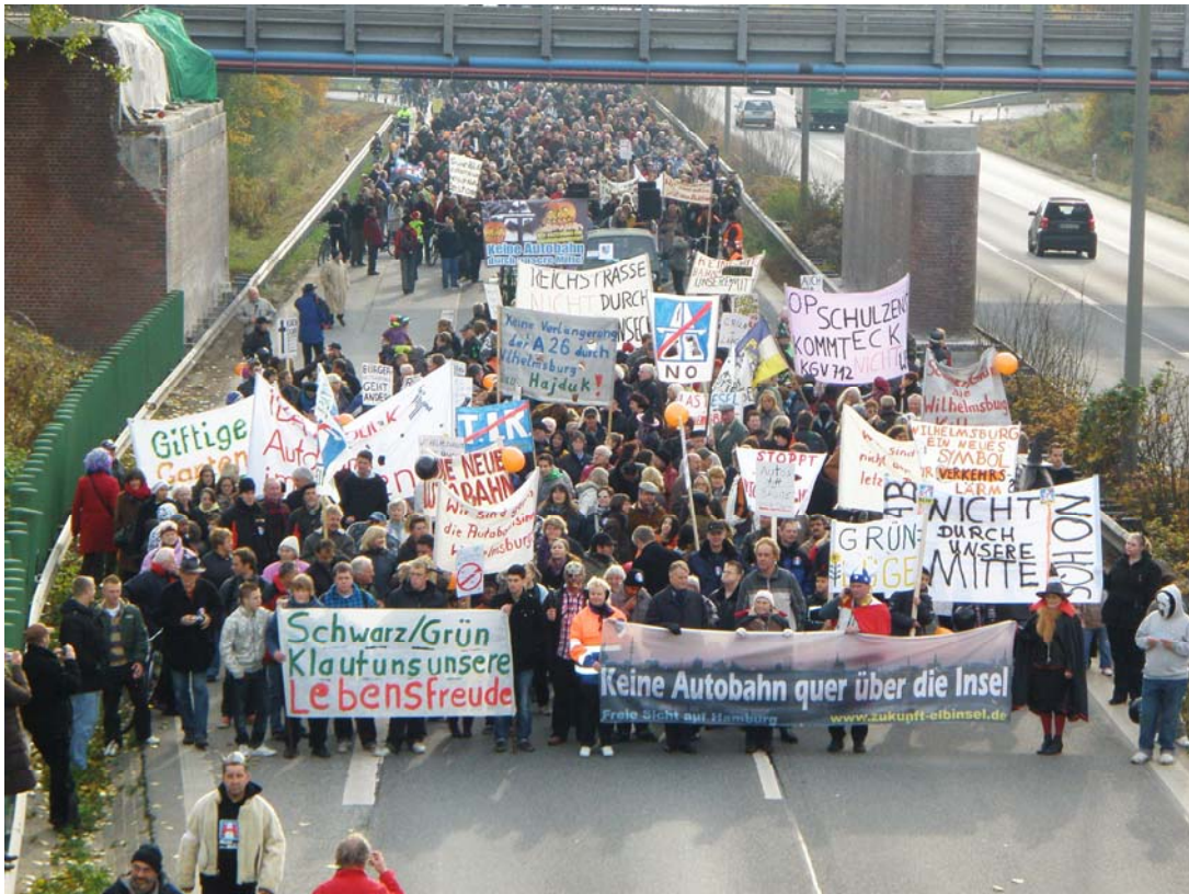
Abbildung 9: 2000 demonstrieren gegen die drohende »Autobahnisierung« der Elbinsel mit 2 weiteren Autobahnprojekten.

Zwei Jahre später machte der damalige Bezirksamtsleiter (8) einen weiteren Vermittlungsversuch mit einem bezirklichen Beratungsgremium zur Verkehrsplanung. Der dort im Konsens aller Beteiligten erreichte Kompromiss wurde kurz darauf vom Senat kalt abserviert.