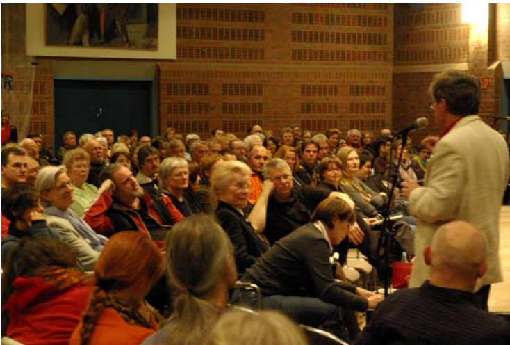
Abbildung 6: Einwohnerversammlungen (wie diese vom 22. Januar 2009) wurden seit 1994 zur bürgerschaftlichen Meinungs- und Willensbildung durchgeführt: als ein selbstorganisiertes Forum direkter Demokratie. In unregelmäßigen Abständen diskutierten meist mehrere hundert Teilnehmende im großen Saal des Bürgerhauses zentrale Wilhelmsburger Themen

gegen die MVA schlossen sich zahlreiche Initiativen und Vereine zu einem wirkungsmächtigen FORUM WILHELMSBURG zusammen. Auf mehreren Einwohnerversammlungen wurden Elemente einer nachhaltigen Entwicklungsstrategie für die vernachlässigte Elbinsel entwickelt. Auf Forderungen, den Ortsausschuss direkt zu wählen und mit einem Stadtteilmanagement wieder mehr Kompetenzen auf der lokalen Ebene zu bündeln, reagierte die seinerzeitige Ortamtsleiterin (5) mit dem Vorwurf, das FORUM wolle ein »Rätesystem« aufbauen: »Die Frage der Macht ist der Kern des Streits«. Stattdessen wurde ein »Beirat für Stadtteilentwicklung« eingerichtet, der Empfehlungen für den Ortsausschuss erarbeiten durfte.