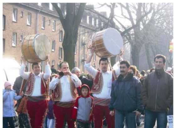
Abbildung 11: Türkische Trommler bei der Karnevalsdemo

In die Aktivitäten der Initiativen und Vereine sind nicht alle Bevölkerungsgruppen gleichermaßen und ausreichend eingebunden. Aber bei großen gemeinsamen Aktionen,