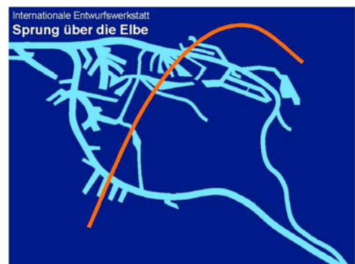
Abbildung 8: Sprung über die Elbe

Die IBA-Jahre bis 2013 waren Stadtentwicklung im »Ausnahmestand«. Ergebnis sind einerseits über 80 interessante Projekte mit teilweise öffentlichem, teilweise privatem Nutzen. Gleichzeitig zeigen andererseits die konstanten Daten zur Armutsentwicklung und die insbesondere eklatant steigenden Mieten, dass eine integrierte Entwicklungsstrategie mehr erfordert als Projekte. Die Kritiker/innen, die eine Gentrifizierung durch die IBA kommen sahen, behielten in vielen Punkten Recht. Beim Versuch, Verkehr und Stadtbau gemeinsam zu entwickeln hat die IBA bei der Hamburger Verkehrsbehörde schnell auf Beton gebissen. Zwei neue Autobahnprojekte kreuz und quer über die Insel standen für diese nicht zur Diskussion. Also ging die IBA beim Verkehr auf Tauchstation. Ihr wurden eigenständige Veranstaltungen dazu untersagt.