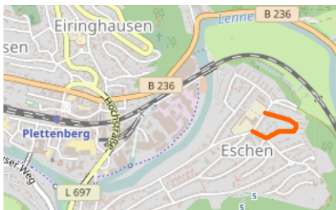
Abbildung 1: Betroffene Straße rot markiert Quelle: OpenStreetMap

Thema: Straßensanierung | Zielgruppe: Anlieger | Beteiligung: Anliegerversammlung (freiwillig) | Ziel: einvernehmliche Straßengestaltung | Stand: aktiv, Pläne werden überarbeitet